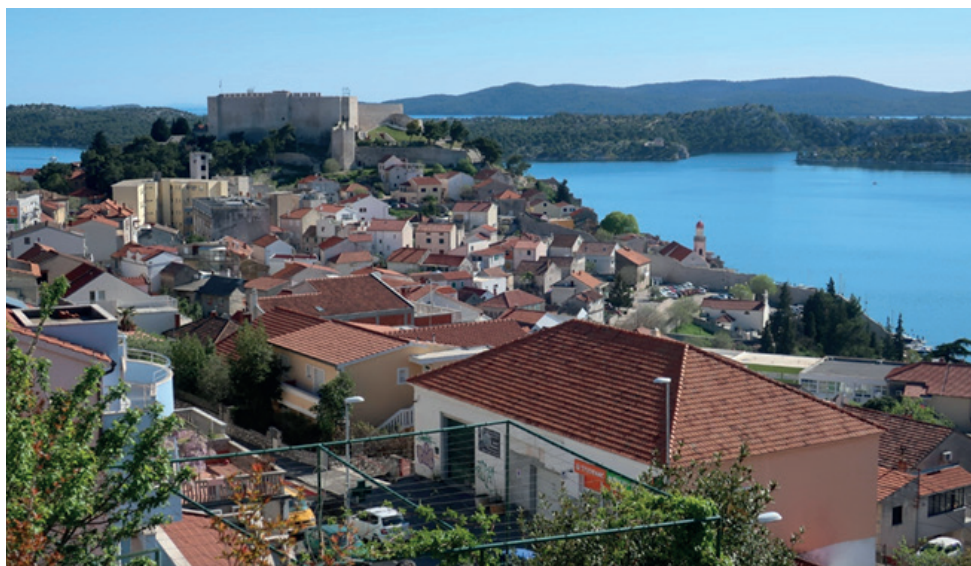
Udsigt over en del af Sibenik