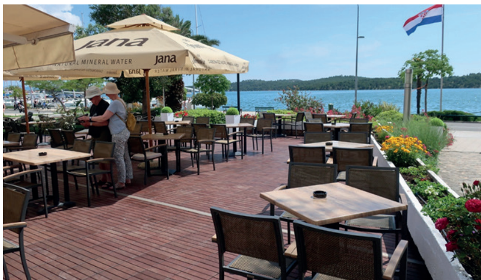
Terrassen på det anbefalede Hotel Jadran