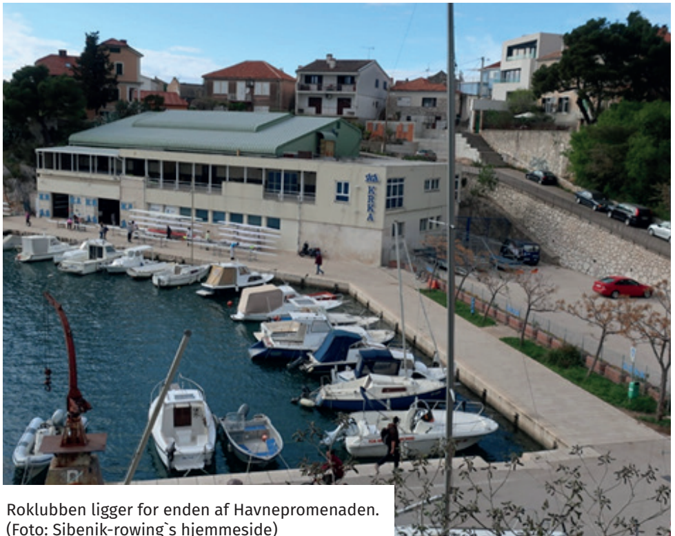
Roklubben ligger for enden af Havnepromenaden.

Klubben råder over 4 ældre to-åres inriggere. Man lægger ikke skjul på, at det er ældre både og flere af dem ikke i tip top stand. Man forventer dog, at de løbende bliver istandsat.