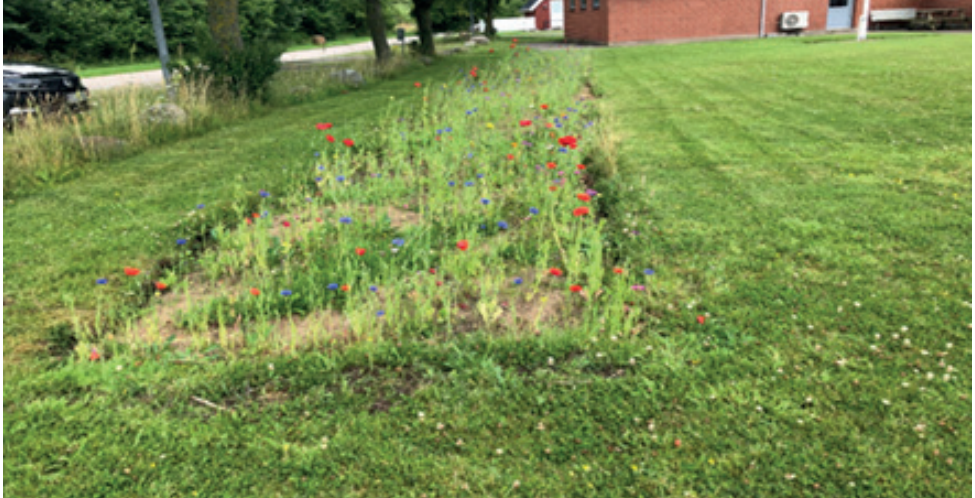
Kajakklubben har lavet et almindeligt bed

Biodiversitet er tidens løsning. Både kajakklubben og roklubben har taget dette til sig.