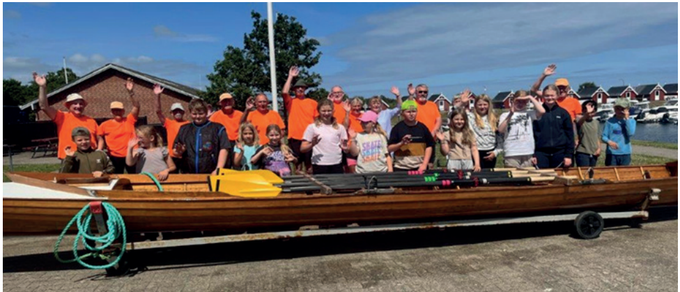
Fremmødet var stort

Efter behørig instruktion fik alle redningsveste på og børnene fik på skift en tur i bådene, der selvfølgelig også var bemandede med roklubbens medlemmer. Der var tre både, der på skift tog børnene med på en tur i inder- og yderhavnen.