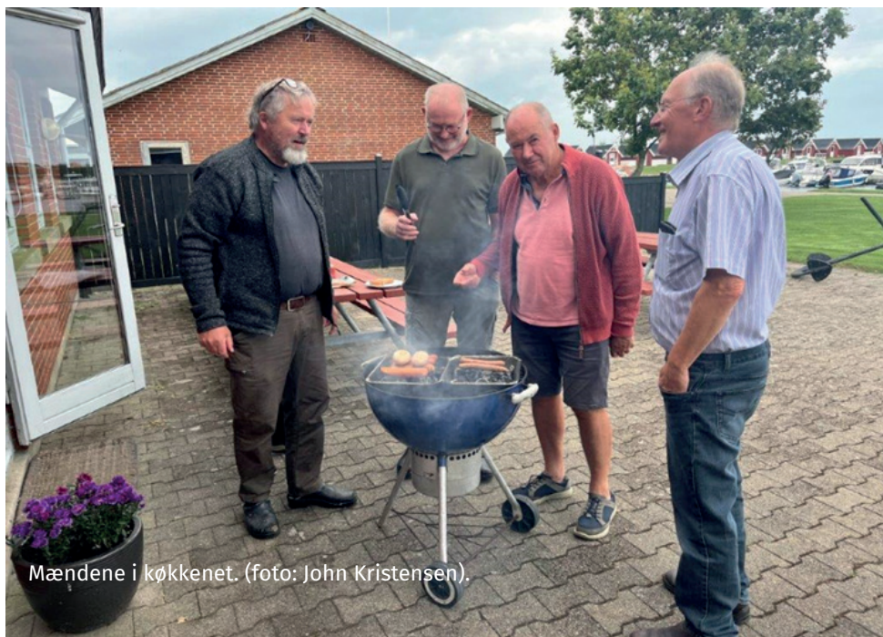
Mændene i køkkenet. (foto: John Kristensen).

Tirsdagen oprandt og kl. ti mødtes vi atter i roklubben for at konstatere, at vinden fra syd ville tage til i løbet af eftermiddagen. Vi var nu 9 roere. Vi aftalte, at ro derover med kaffe, en enkelt øl og lidt vin. Ro en tur rundt om øen og hjem til klubben, hvor vi ville grille og indtage vores mad og drikke.