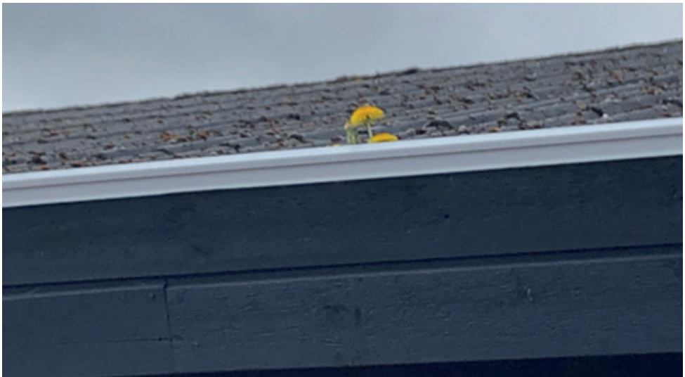
Roklubben har derimod lavet et "højbed".