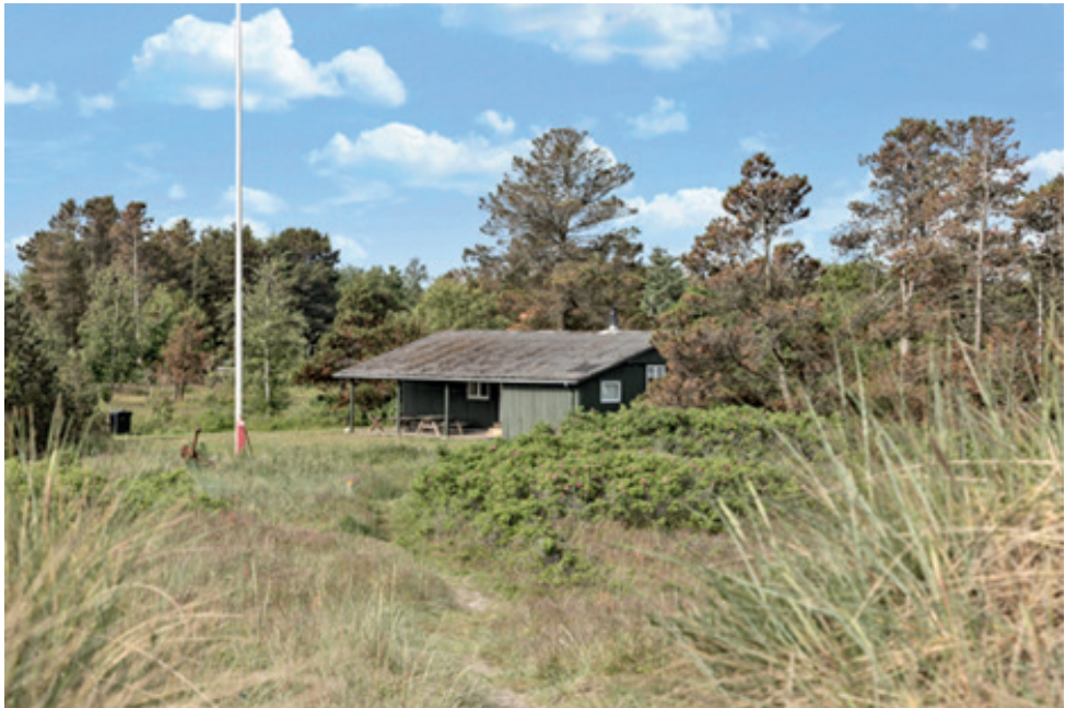
Sommerhuset ligger da flot.

De seneste år er udlejningen af sommerhuset sket gennem et bureau, så vi ikke selv skal stå for besværet. Med hensyn til pasning og udlejning af huset, er der, ligesom med så meget andet, tale om "Tordenskiolds Soldater", så det er med at gøre det så nemt som muligt. Klubben har en stor årlig indtægt ved denne udlejning, hvilket er medvirkende til at drive klubben.