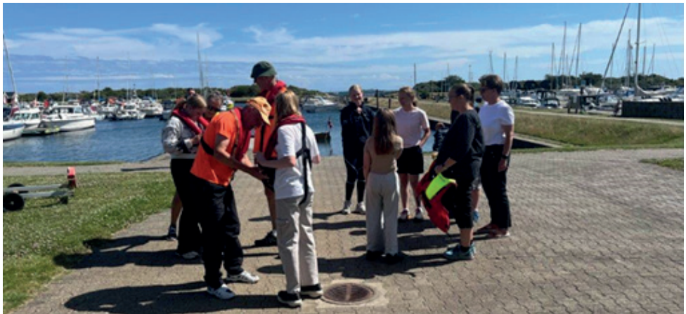
Alle blev behørigt instrueret

En god dag med "èn på opleveren" for de unge mennesker.