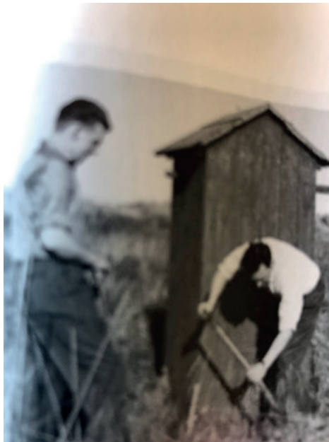
Det gamle "skilderhus"

Efter knap 20 år blev det dog for primitivt og i 1967 indviede man den nuværende toiletbygning med indgang fra sommerhusets terrasse. Der var 2 toiletter, brusebad og vaskefaciliteter. Nu var huset fremtidssikret.