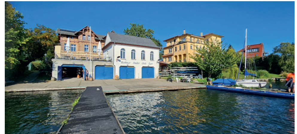
Berlin Ruder Club Ägir