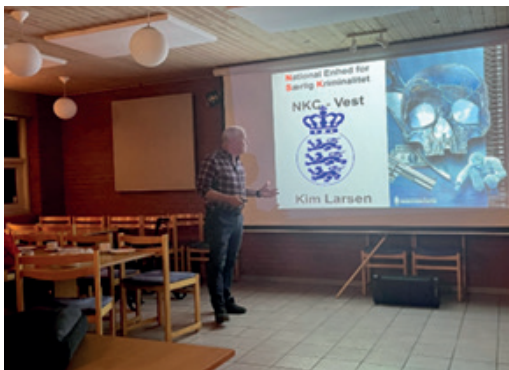
Et særdeles interessant foredrag