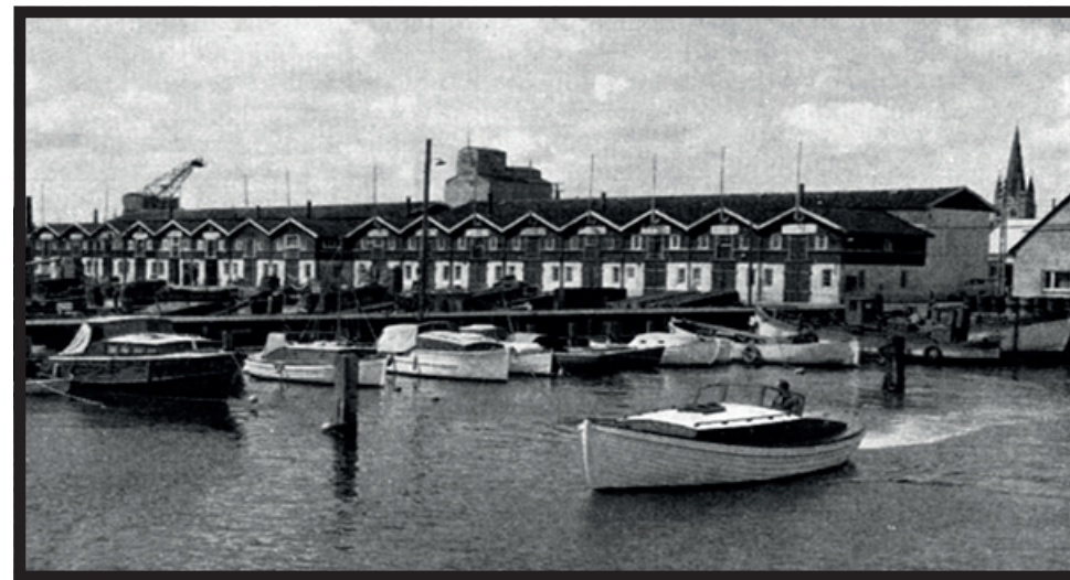
Det gamle havnebassin med de røde fiskerhuse

Før man måtte ro skulle man have instruktion af erfarne roere. Den første gang kom jeg end ikke ned i en båd og sidde, men hørte om kun bagbord, styrbord, kølsvin, spanter, langrem og hvad det alt sammen nu hedder. Derefter kom man i en fire' r og lærte at ro inde i havnen. Havnen var jo stor, der var hele fiskerihavnen, yderhavnen og endelig trafikhavnen. Trafikhavnen måtte vi, mod fornøden forsigtighed, godt ro ind i den gang. Det var spændende, når færgerne kom og gik, men hvor var det svært at ro, når færgerne manøvrerede og havnen var fuld af "skruevand". Det var næsten ikke til at drive båden frem når vandet var pisket op af de store skruer.