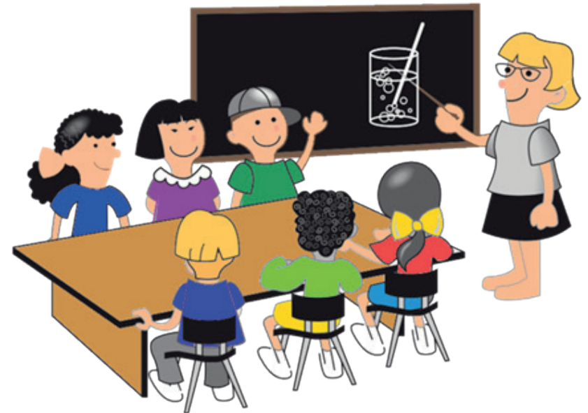
Skolebænken kalder