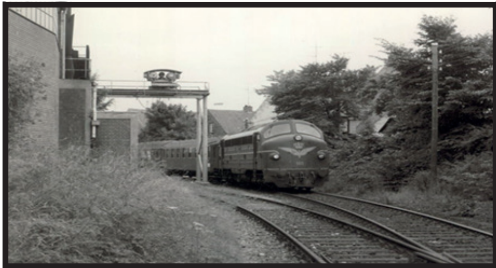
Banen ned til havnen