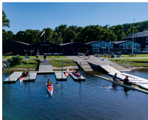
Skive Roklub har en smuk beliggenhed (billederne er fundet på nettet)

Efter et par ture på a` fjord skulle jeg prøve deres outrigger, der var en fire åres kaproningsbåd. Den var godt nok lav og meget urolig. Det blev vist også kun til en enkelt tur i den, hvis jeg husker rigtig.