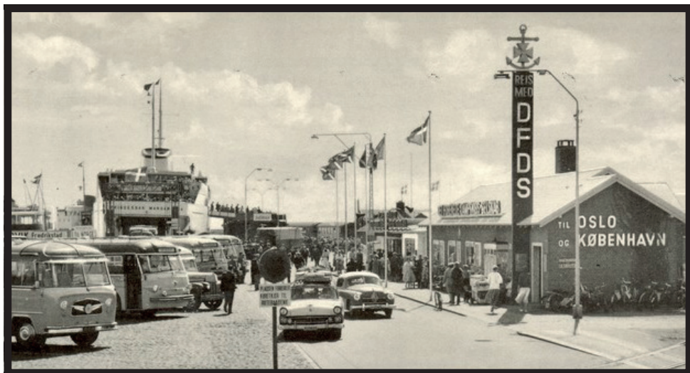
Den gamle Havneplads med DFDS's kontor i forgrunden

Et par år efter, nærmere bestemt 1966, mødte jeg op i klubben en tidlig forårsdag. Jeg ville være roer. Af et par kammerater, der var medlemmer, havde jeg fået at vide, at det var sjovest om aftenen. Der var dog det problem, at man skulle være 17 år for at ro om aftenen. Jeg startede derfor med at lyve mig et år ældre end jeg i virkeligheden var. Det fandt jeg senere ud af, der var flere der havde gjort.