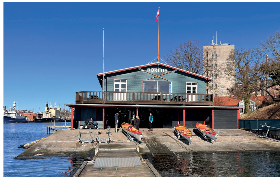
Svendborg Roklubs dejlige terrasse på 1. sal

Det sydfynske øhav er rigt repræsenteret i hæftet. I Svendborg har de to inriggere, hvoraf den ene er særdeles godt kendt her i klubben, idet den først blev placeret i Frederikshavn og fik navnet Hirsholm. Efter få år blev den imidlertid flyttet til Svendborg. Hvorfor kan jeg kun gisne om, men den blev ikke lejet ret meget ud og det har nok været den egentlige grund til flytningen. Så hvis du vil have et gensyn med den første Hirsholm, så skal du en tur til Svendborg.